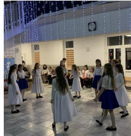
Zoveel blij gezichtjes!!